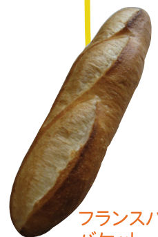
フランスパン バケット