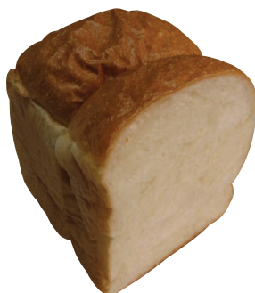
山型パン イギリス